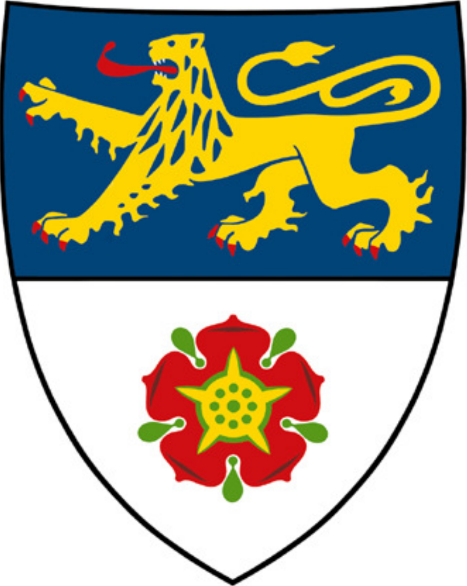
Abbildung 1: Stadtwappen